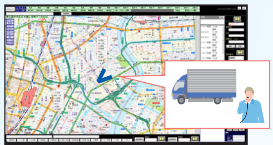
通話してきた無線機の位置を画面中央に表示