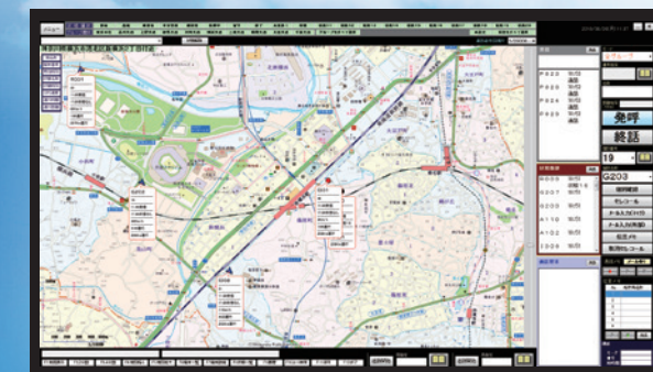
指令局構成例 (iGPS7plus + SV-2000)