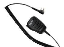
防水スピーカーマイク SK-M04 (IP67*相当防水・防塵性能 スピーカー出力 0.5W)