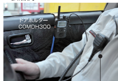
大音量スピーカーマイク MP16