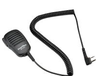
スピーカーマイク SK-M01 (スピーカー出力 0.5W 3.5φイヤホン端子付き)

※運転中のイヤホン、ヘッドホンの装着は各都道府県の条例で規制されている場合があります。