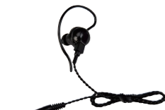
スピーカーマイク用 イヤホン SK-E01 (ケーブル長 約0.5m)