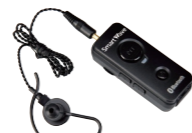
Bluetooth® イヤホンマイク SK-M03