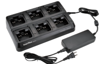
6連急速充電器 (ACアダプタ付) SK-P04