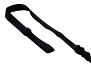
ネック ストラップ SK-T03