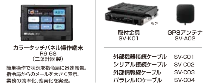
カラータッチパネル操作端末 R9-6S (二葉計器製) 外部機器接続ケーブル SV-C01 シリアル接続ケーブル SV-C02 外部情報線ケーブル SV-C03 パラレルI/Oケーブル SV-C04 取付金具 SV-K01 GPSアンテナ SV-A02