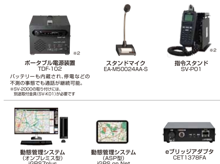
ポータブル電源装置 TDF-102 スタンドマイク EA-M50024AA-S 指令スタンド SV-P01 動態管理システム (オンプレミス型) iGPS7plus 動態管理システム (ASP型) iGPS on Net eブリッジアダプタ CET1378FA

バッテリーも内蔵され、停電などの不測の事態でも通話が継続可能。 ※SV-2000の取り付けには、別途取付金具(SV-K01)が必要です インターネットに依存しない専用の高セキュリティシステム インターネット環境で手軽に始められるシステム eブリッジアダプタはデジタル簡易無線(DCR)を中心に、主要な無線機メーカーの無線機と接続できます。 ※対応機器は営業担当者にお問い合わせください。