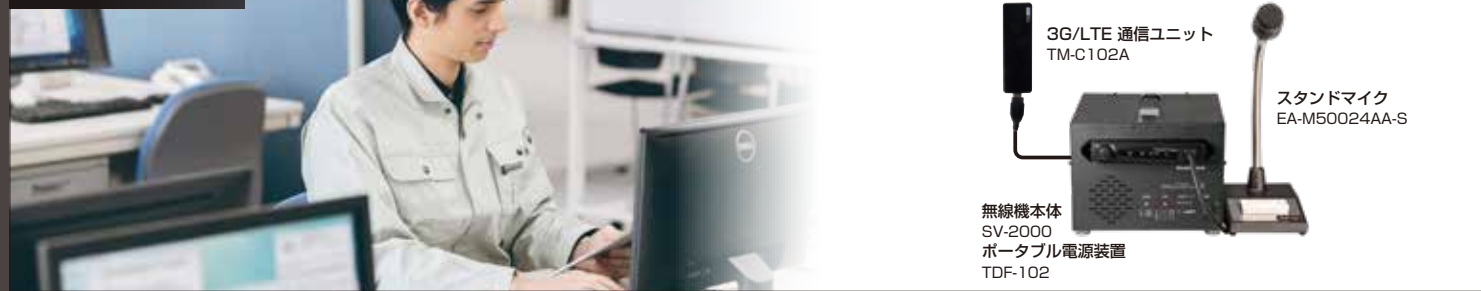
3G/LTE通信ユニット TM-C102A スタンドマイク EA-M50024AA-S 無線機本体 SV-2000 ポータブル電源装置 TDF-102