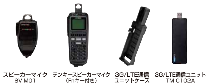
スピーカーマイク SV-M01 テンキースピーカーマイク (Fnキー付き) EH-M01 3G/LTE通信ユニットケース TA-Z013A 3G/LTE通信ユニット TM-C102A