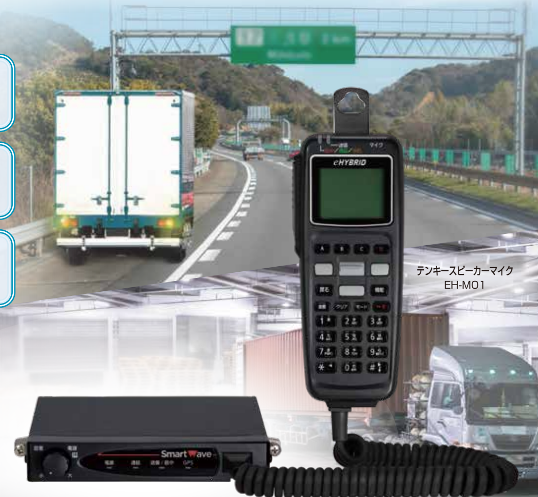
テンキースピーカーマイク EH-M01