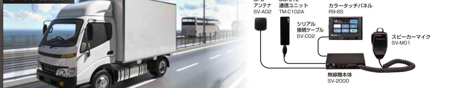
GPSアンテナ SV-A02 3G/LTE通信ユニット TM-C102A カラータッチパネル R9-6S シリアル接続ケーブル SV-C02 スピーカーマイク SV-M01 無線機本体 SV-2000